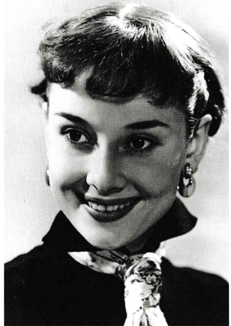
Fotografie de studio de la începutul anilor '50, care o înfățișează pe Audrey cu renumitul ei breton și o eșarfă de mătase la gât, imagine pe care o prefera în perioada ei de debut.

Astăzi, imaginea „Audrey” este atât de bine croită în conștiința noastră încât uităm cu ușurință cât de revoluționară era atunci când a interpretat, în 1953, rolul prințesei Ann din filmul Vacanță la Roma alături de Gregory Peck în rolul lui Joe Bradley, un ziarist american. Cu trăsăturile ei fine și diafane, cu trupul ei mlădios și ținutele-i școlărești, creațiile legendarei creatoare de modă Edith Head, Hepburn debuta într-o perioadă în care imaginea de star de cinema presupunea forme exagerat de feminine, ca cele ale divelor Marilyn Monroe și Jane Russell. Sau, după cum spunea la vremea respectivă regizorul Billy Wilder, cel care avea să-i ofere următorul rol principal din filmul Sabrina (1954): „După atâtea ospătărițe care devin staruri de cinema, avem, în sfârșit, și un moment de respiro, când ne